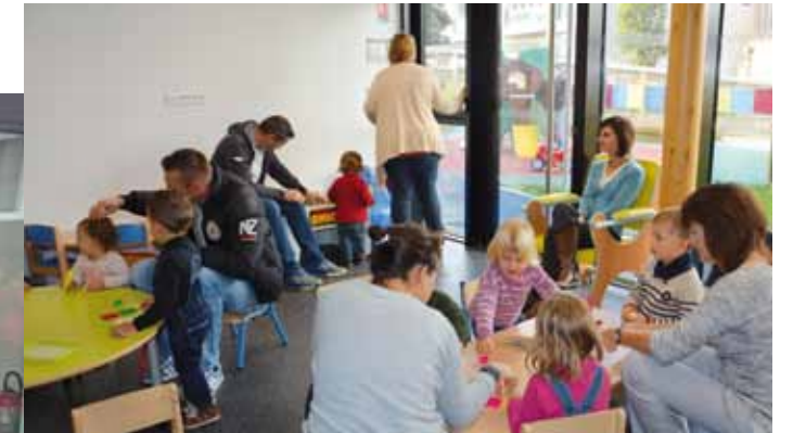
Les ateliers proposés par le personnel de la crèche lors de l'inauguration ont séduit les plus petits mais aussi... les plus grands !