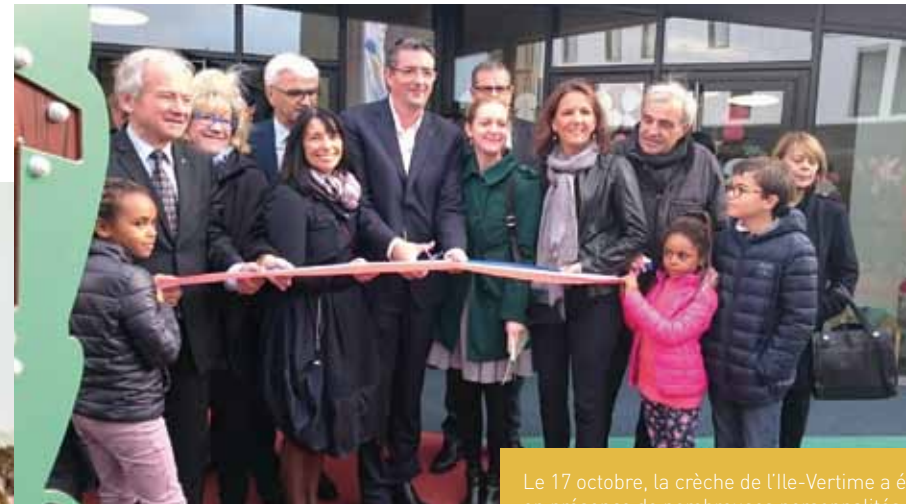
Le 17 octobre, la crèche de l'île-Vertime a été inaugurée en présence de nombreuses personnalités.