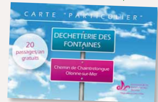
PLATE-FORME CARTE DÉCHETTERIE cco.servicesauxcitoyens.fr

Attention : aucune carte ne sera délivrée à la déchetterie des Fontaines ou au siège de la CCO. Les professionnels résidant sur l'agglomération des Olonnes peuvent eux aussi bénéficier d'un pass. Ce service est payant et le forfait demandé est de 20 € par passage.